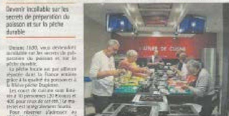
Comment mieux se servir les produits de la pêche écopêche ? Suivre les ateliers culinaires.

Devenir incollable sur les secrets de préparation du poisson et sur la pêche durable. Ils sont nombreux à venir à la découverte de la langue des signes.