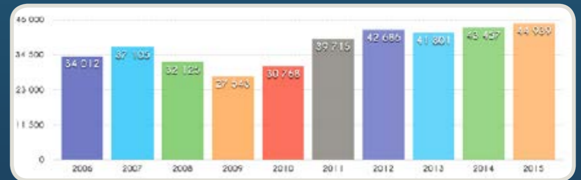
Graphique en barres de la fréquentation annuelle entre 2006 et 2015

587 071 € : budget annuel 2015 de fonctionnement de Maréis