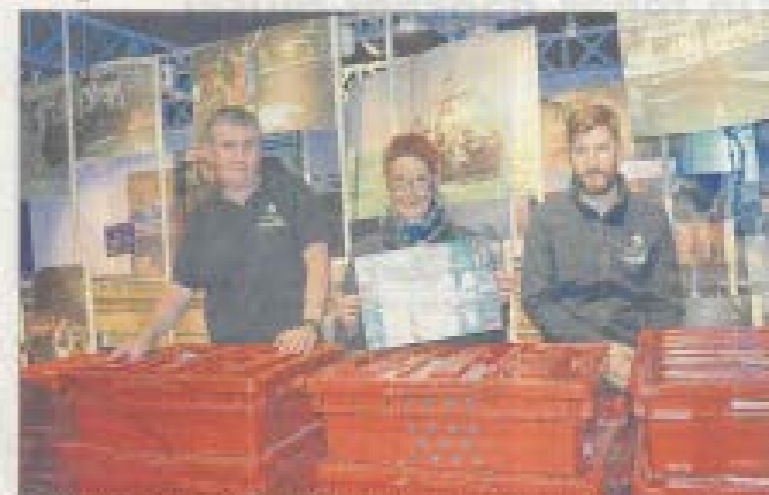
Équipe de Maréis avec le contenu d'écoles autour de la pêche vert. Diffusé en guide pratique pour les consommateurs de poissons.

Vous souhaitez aussi en découvrir quelques-uns de nos produits locaux ? Vous souhaitez aussi en découvrir quelques-uns de nos produits locaux ?