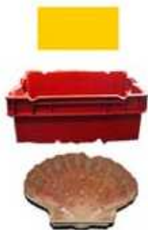
La Coquille St Jacques