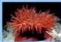
L'anémone de mer