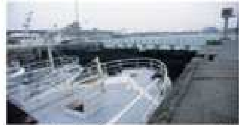
Arrivée au port

Pour rentrer au port le marin utilise les feux de navigation, il laisse à sa droite le feu vert et à sa gauche le feu rouge.