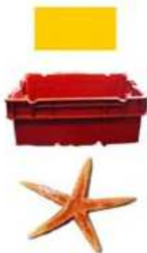
L'étoile de mer