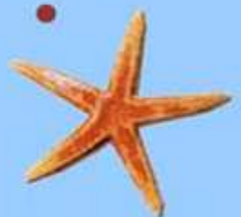
L'étoile de mer