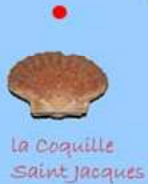
La Coquille Saint Jacques